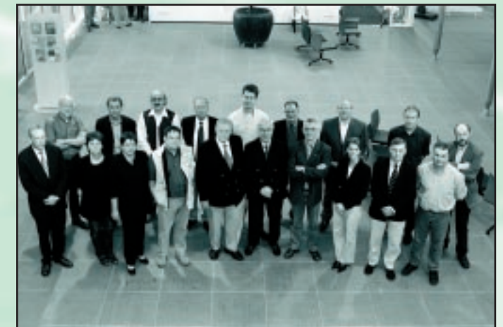
De intergemeentelijke raadscommissie voor het eerst bijeen

Ook heeft elke gemeente, behalve Rhenen, plaatsvervangende leden aangewezen.