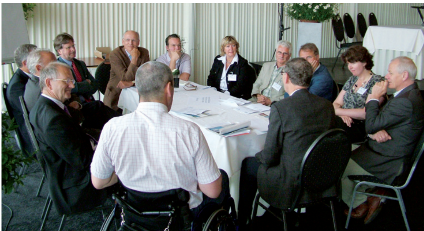
In deelgroepen werd levendig gediscussieerd over het versterken van recreatie en toerisme in de regio.

gewerkt aan het herstellen van historische voetpaden en het ontwikkelen van rondwandelingen door het agrarische cultuurlandschap. Inmiddels zijn zestien zogenoemde Klompenpaden in de provincie Utrecht en acht in de provincie Gelderland geopend. Duizenden mensen uit de regio, maar ook daarbuiten, bewandelen de paden inmiddels. De Klompenpaden versterken de lokale economie door aan te haken bij initiatieven als kamperen bij de boer of verkoop van streekelijke producten. Daarnaast bieden de paden agrariërs in het gebied de mogelijkheid om neveninkomsten te genereren door hun