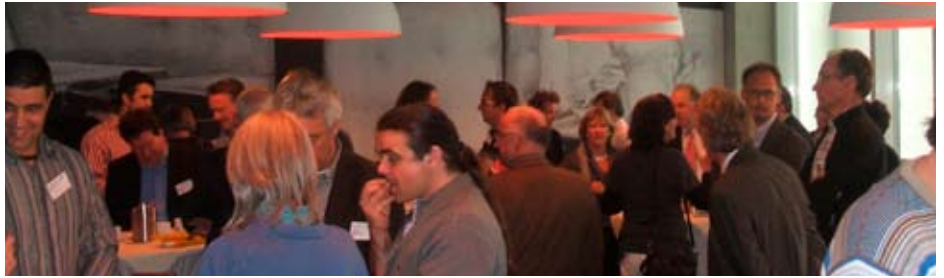
Raadsleden tijdens de themabijeenkomst in Wageningen

Het besluit van de WERV-gemeenten om op grotere schaal te gaan samenwerken, is het resultaat van de toekomstverkenning van de WERV-samenwerking en de daaruit voortgevloede Strategische agenda WERV+B (Barneveld). Deze agenda is een uitwerking van het grootschaliger concept FoodValley, dat als basis voor de nieuwe samenwerkings-identiteit is gekozen. De ambitie om, overeenkomstig het kabinetsprogramma Pieken in de Delta en de Lissabonagenda, één van de belangrijkste gebieden in de wereld te worden