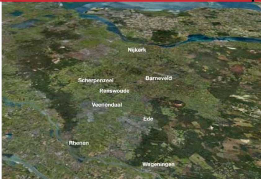
De acht gemeenten in Regio FoodValley